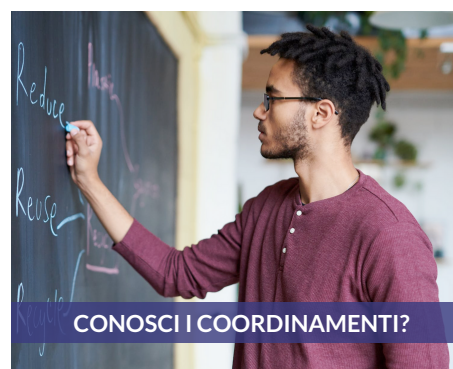
CONOSCI I COORDINAMENTI?

Possono candidarsi solo i Soci in regola con il pagamento della quota associativa dell'anno in corso e iscritti da almeno 6 mesi (17.07.2019) al Coordinamento Regionale per il quale si candidano. Scadenza: 03.02.2020