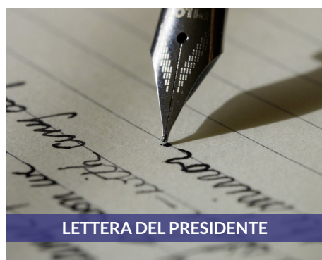
LETTERA DEL PRESIDENTE