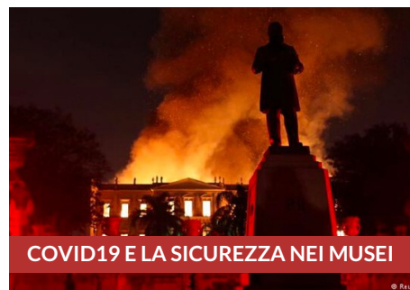
COVID19 E LA SICUREZZA NEI MUSEI

Raccomandazioni per la tutela e la sicurezza nei Musei in emergenza COVID-19