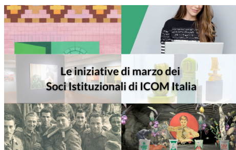
Le iniziative di marzo dei Soci Istituzionali di ICOM Italia